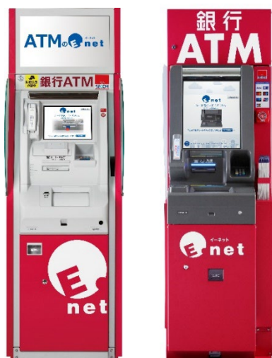
〈イーネット ATM 現行2機種〉 CZ6000機 CZ7000機(新型)